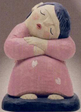
松田京子 「春うらら」 10×10×14cm