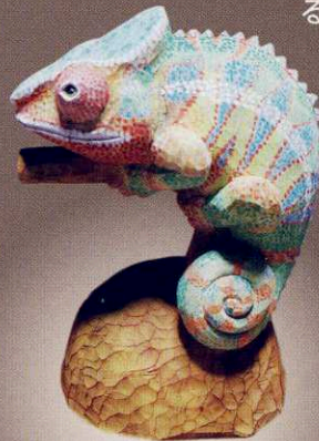
中尾健二 「カメレオン」 13×10×21cm

100点を超える作品は、養豊氏（兵庫県立美術館長）、山田洋次氏（映画監督・第10回まで）をはじめとする審査員が優秀作品を選考してきました。