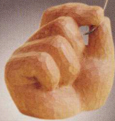
長尾恵那 「普通のクロワッパ」 14×9×7cm