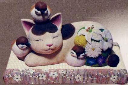
勝部 梓 「眠りねことすずめ」 25×13×15cm