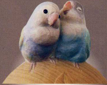
梅野浩彦 「peaceful life」 20×13×18cm