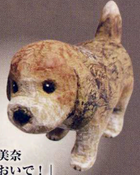
河野美奈 「こっちにおいで!」 5×12×9cm