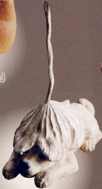
前田忠一 「アンテナ」 40×23×50cm