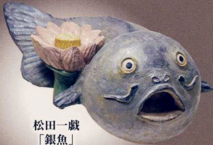
松田一戯 「銀魚」 20×29×12cm