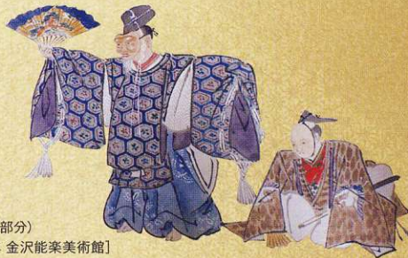
能楽絵集(部分) [明治27年 金沢能楽美術館]

このたびは新たに寄贈される品を含め、所蔵品のなかから高砂や翁など寿の演目を描いた能面を中心に展示いたします。