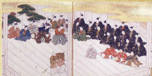
高砂演能図屏風(部分) [江戸時代 金沢能楽美術館]