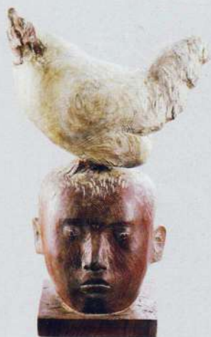
第20回公募展 グランプリ 「アタマニワトリ」 池田雅彦